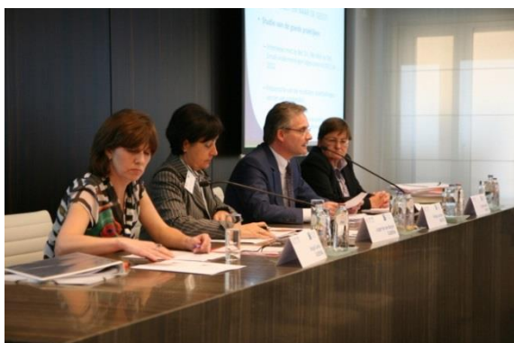
Table ronde Session II